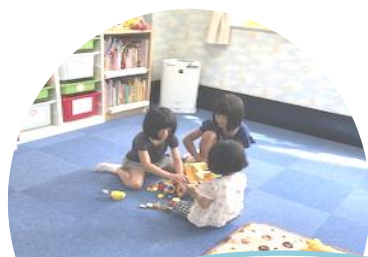
仲良く遊んでるね♪

今回は利用手順や、お薬・持ち物などをわかりやすく書いたポスターを作り掲示しました。保護者の方が登録手続きをしている間、お子さんには可愛いカードの製作を用意しました。乳児さんのご家族は、お父さんが製作に参加してくれました！普段のお子さんの様子を伺ったり、とても和やかな雰囲気で見学会を開催する事ができました。